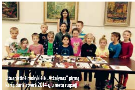
Lituanstinė mokyklėlė „Atžalynas“ pirmą kartą duris atvėrė 2014-ųjų metų rugsėjį