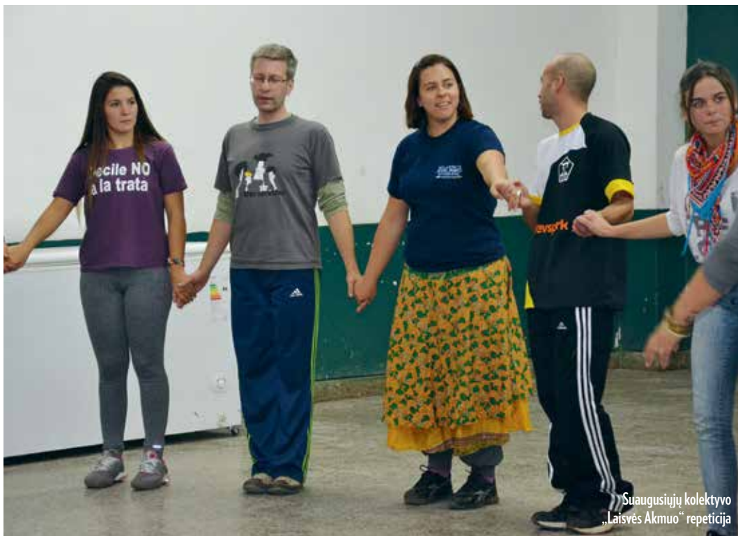
Suaugusiųjų kolektyvo „Laisvės Akmuo“ repeticija

Tandilio bendruomenės nariai teigia visada buvę labai sužavėti lietuviška veikla kituose Argentininos miestuose, tačiau jiems trūko informacijos apie bendruomenių veiklą ir renginius. Tiesa, keli bendruomenės nariai kilę iš Buenos Airių, tad jie ne tik palaikė glaudesnius ryšius su sostinės lietuviškomis organizacijomis, bet ir šeimose buvo išsaugoję kai kurias lietuviškas tradicijas.