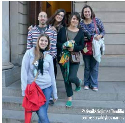
Pasivaikščiavimas Tandilio centre su valdybos nariais

Labai įdomu stebėti, kaip ši bendruomenė atranda savo lietuvišką tapatybę, jos lietuviška patirtis jau yra visai kitokia nei daugumos kitų Argentinos (o gal net ir visos Pietų Amerikos) lietuviškų organizacijų. Čia dažniausiai bendruomenės mena įvairiausius Lietuvos istorijos laikmečius, daug kur žaižaruoja smetoniškos Lietuvos atspindžiai: galima išgirsti tuometę lietuvišką šneką, sutikti vienu kitiems klijuojamą „komunisto“ lipduką, iš kartos į kartą vaikams ir vaikaičiams perduodamas draugystės arba nepalankias nuostatas, kurių jauniausios kartos stengiasi atsikratyti. O Tandilio „Laisva Lietuva“ tapatinasi su Nepriklausomybės vaikų karta, kuri Lietuvą atranda iš mūsiškos Lietuvos perspektyvos. Besijausdami visai argentiniečiai, jie semiasi lietuviškumo ir pamažu tampa lietuviais kasmet keliaudami į Lietuvą, vis aktyviau įsitraukdami į vietinių ir pasaulinių lietuviškų bendruomenių veiklą. Tandilio jaunimas